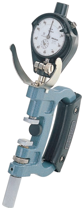
201-101 opcionális tartozékokkal