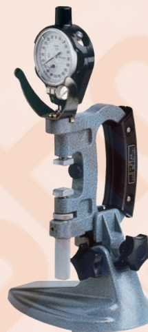
201-101 opcionális tartozékokkal: 156-101-10 állvány 2109SB-10 mérőóra