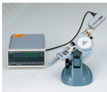
Minta alkalmazás: Linear Gage-el