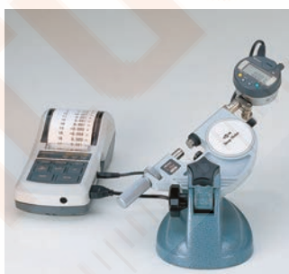
Minta alkalmazás: mérőórával