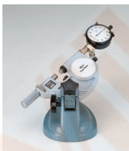
Minta alkalmazás: mérőórával