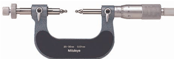
124-173 opcionális tartozékokkal