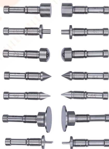
Opcionálisan cserélhető betétek