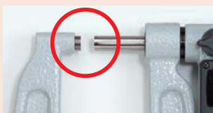
A típus Sík-Sík