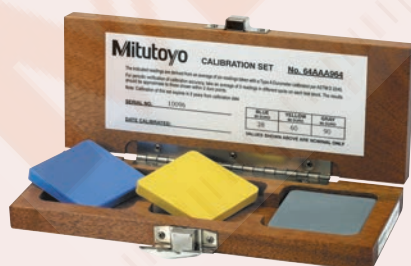
64AAA590 Shore D