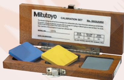
64AAA964 Shore A