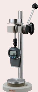
Testing stand - Workstage dimension: Ø90 mm - Max. specimen height: 90mm