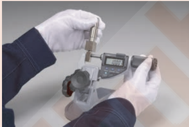
293-666-20 állvánnyal 156-101-10 (különtartozék)