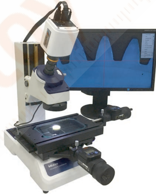
TM-1005B opcionális LED gyűrűsfénnyel (63AAA001), 0.37X szemlence adapter (63AAA060) és digitális HDMI kamera (63AAA059)