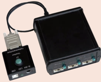
Alkalmazás minta DMX-el