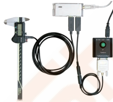
Alkalmazási minta USB Input Tool Direct eszközzel