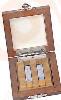
2 db-os hasábkészlet