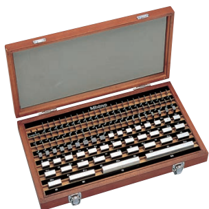
103 db-os acél hasábkészlet