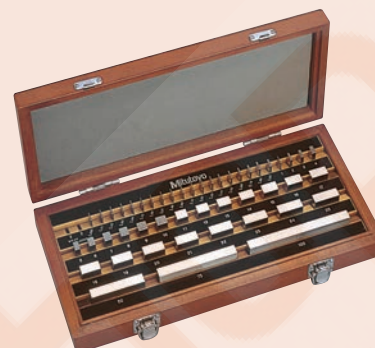
47 db-os acél hasábkészlet