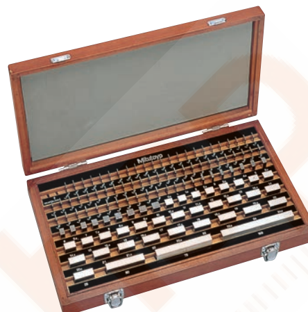
103 db-os acél hasábkészlet