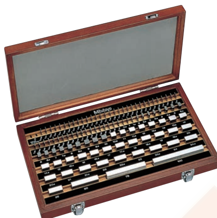
112 db-os acél hasábkészlet