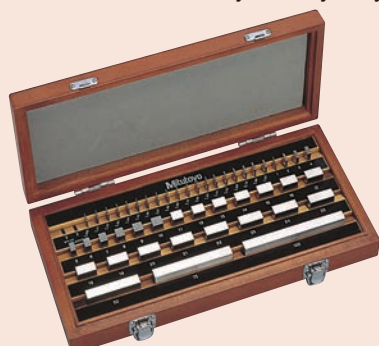
47 db-os acél hasábkészlet