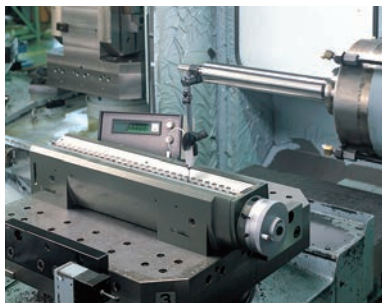
Használat vízszintes elrendezésben