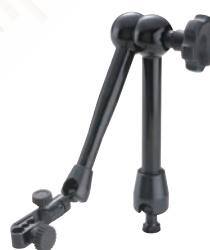
56AAK793 Mechanikus rögzítés Méret: lásd 7033B