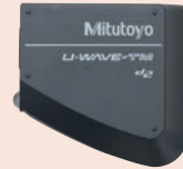
264-622 + 02AZF310 U-WAVE-TM (Adó) + csatlakozó egység