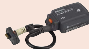
02AZD730G + 02AZD790A U-WAVE-T (Adó) + csatlakozó kábel