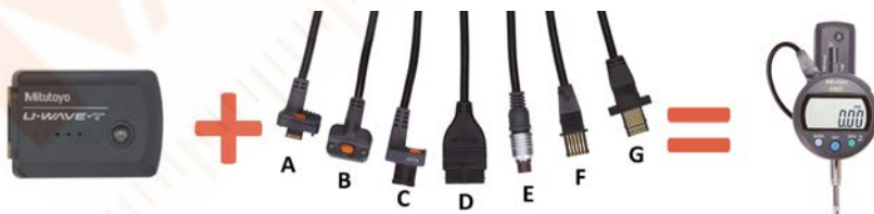
Adó és csatlakozó kábel (lásd következő oldal) pl.: digitális mérőórához