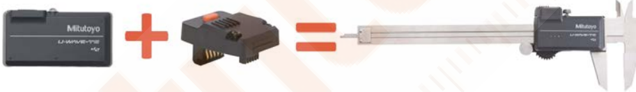
Adó és csatlakozó egység (lásd következő oldal) tolómérőhöz (U-WAVE-TC + 02AZF300)