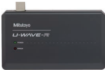
02AZD810D U-WAVE-R (vevő)