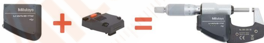
Adó és csatlakozó egység (lásd következő oldal) mikrométerhez (U-WAVE-TM + 02AZF310)