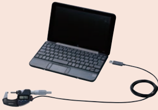
(1) USB Input Tool Direct kábel 2 m

Kérjük keresse meg a Digimatic mérő műszerének megfelelő kábeleket a katalógus "Opcionális kiegészítők" részében.