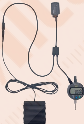
(3) U-WAVE csatlakozó kábel lábkapcsoló csatlakozóval (FSW)