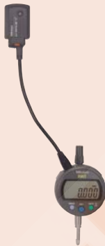
(3) U-WAVE csatlakozó kábel (Standard)