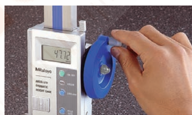
Nagy, sima csúszka Kézikerék