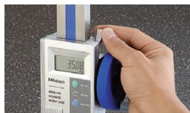
Nagy rögzítő kar