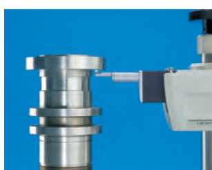
Alsó felület mérése