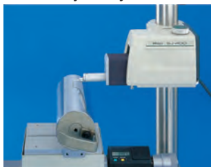
Íves felület mérése