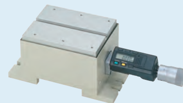
178-048 D.A.T. szintező asztal