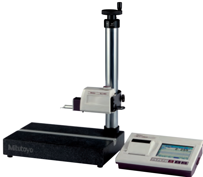
178-039 (a képen SJ-411-el)