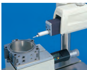
Mély horony mérés

Sorozat 178 - Hordozható felületi érdességmérő