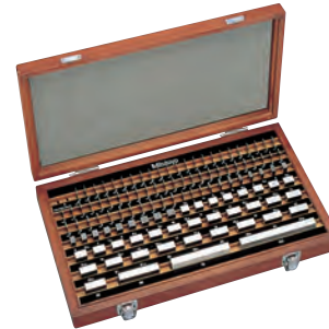
103 db-os acél hasábkészlet