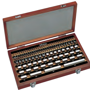
112 db-os acél hasábkészlet