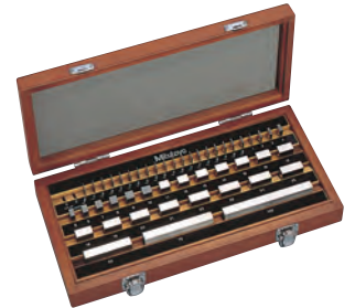
47 db-os acél hasábkészlet