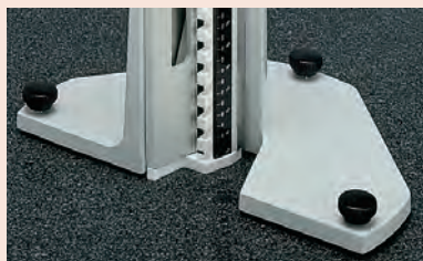
601167 (opció) Támasztóláb függőleges elrendezéshez