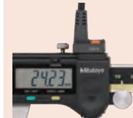
Standard Absolute tolmérő 02AZD790C kábellel