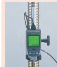
Digimatic ID-H mérőóra 02AZD790D kábellel