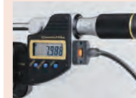
QuantuMike 02AZD790B kábellel