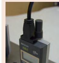
ABS Digimatic ID-N mérőóra 02AZD790G kábellel