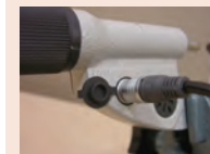
Quick mikrométer 02AZD790E kábellel