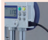
Digimatic magasságmérő 02AZD790F kábellel