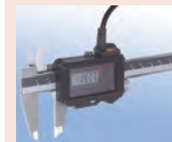
Példa: Super tolmérő 02AZD790A kábellel