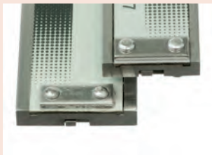
150 és 200 mm vagy 300 mm